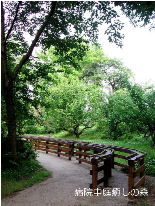
病院中庭癒しの森